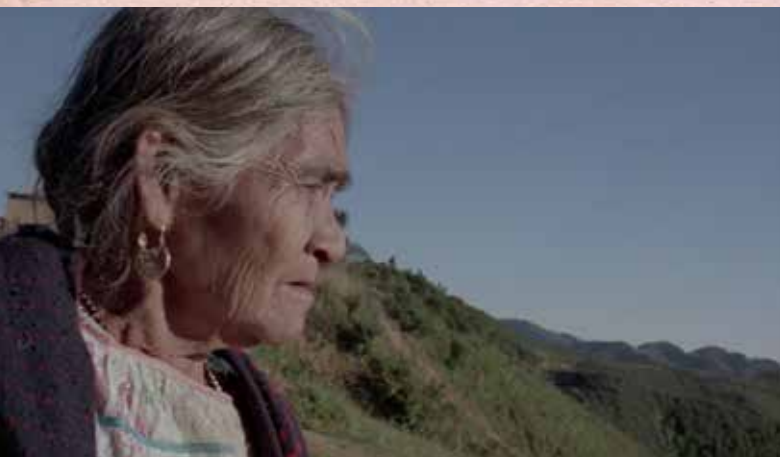
Fotogramas María Sabina, mujer espíritu de Nicolás Echeverría. Link de Retina Latina para mirar la película completa: https://www.retinalatina.org/video/maria-sabina/

En la imagen es importante la prevalencia de colores en tonos tierra, desaturados, que acompañen los colores de la naturaleza en la que se desarrolla la película con la intención de integrar al espectador en la sensación de resguardo y calor que este ecosistema representa en la relación padre e hija en el que se concentra el filme.