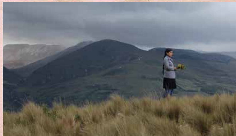
Fotogramas Hija de la Laguna de Ernesto Cabellos. Disponible en la plataforma Netflix , link para tráiler: https://www.youtube.com/watch?v=ikrmt1QWGqE